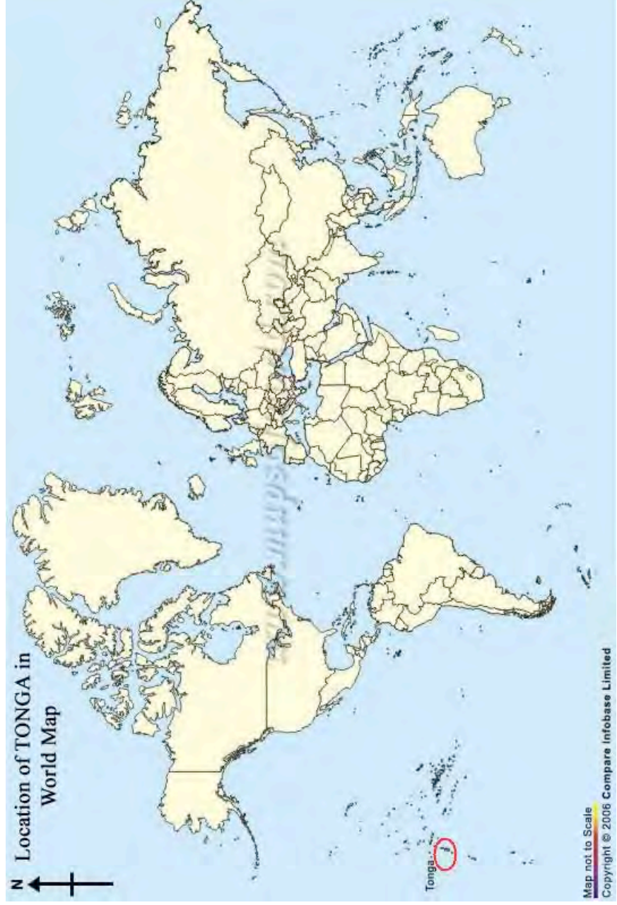
Location of TONGA in World Map

Map not to Scale Copyright © 2006 Compare Infobase Limited